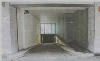
Hier passierte der sexuelle Übergriff.

Es geschah in der Nacht auf letzten Samstag: Eine 20-Jährige feierte gemeinsam mit mehreren Begleitpersonen im Zürcher Szene-Club Kaufleuten. Dort lernte sie einen anderen Gast kennen und ging um 2 Uhr morgens mit ihm nach draussen, um kurz Luft zu schnappen, wie die Stadtpolizei Zürich gestern mitteilte. Bei der Garageneinfahrt des UBS-Konferenzgebäudes Grüenhof an der Nüscherstrasse 9 wurde der Mann plötzlich zu-