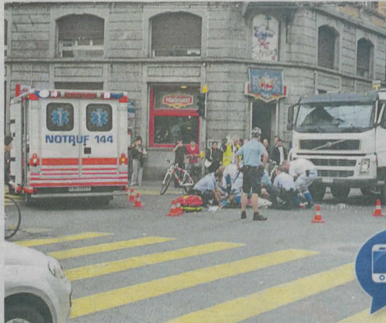
Der Motorradlenker wurde bei seinem Überholmanöver schwer verletzt.

ZÜRICH. Bei einer Kollision mit einem Lastwagen hat ein 40-jähriger Töfffahrer am Montagmorgen im Zürcher Kreis 4 schwere Kopfverletzungen erlitten. Der genaue Unfallhergang ist noch unklar, wie die Stapo mitteilte. Gemäss ersten Erkenntnissen fuhr der Mann kurz vor 10 Uhr mit seinem Motorrad auf der Langstrasse vom Limmatplatz in Richtung Kreis 4. Laut ersten Zeugenaussagen überholte er vor der Verzweigung Militär-/Langstrasse einen Personenwagen, ehe er auf der Kreuzung in den von links kommenden Lastwagen prallte. Der 30-jährige Lastwagenchauffeur blieb unverletzt. SDA